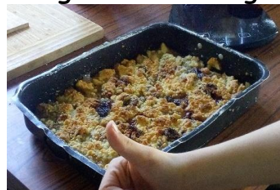
Le gâteau de Diégo