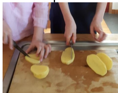
La préparation des frites pour Nola