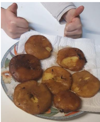
Les beignets aux pommes de Camille