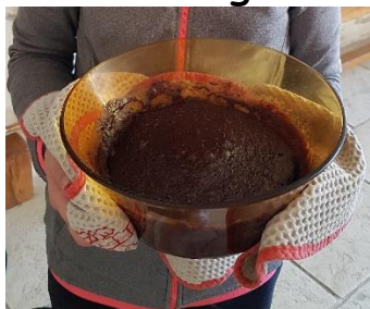
Le gâteau au chocolat de Margot