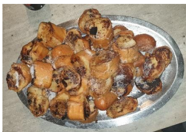
Le pain perdu de Shanel