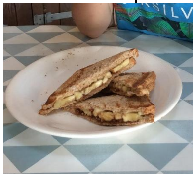
Le croque choco-banane de Baptiste